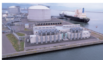
北ガス石狩発電所 (天然ガスコージェネレーション)

「北ガスの電気」は、発電時の排熱を有効活用する「天然ガスコージェネレーション」や、発電時にCO 2 をほとんど排出しない「再生可能エネルギー（木質バイオマス発電・太陽光発電など）」といった環境にやさしい電源を積極的に調達し、運用しています。