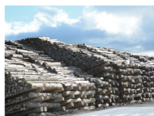
苫小牧バイオマス発電 (道内産の未利用間伐材を使用)